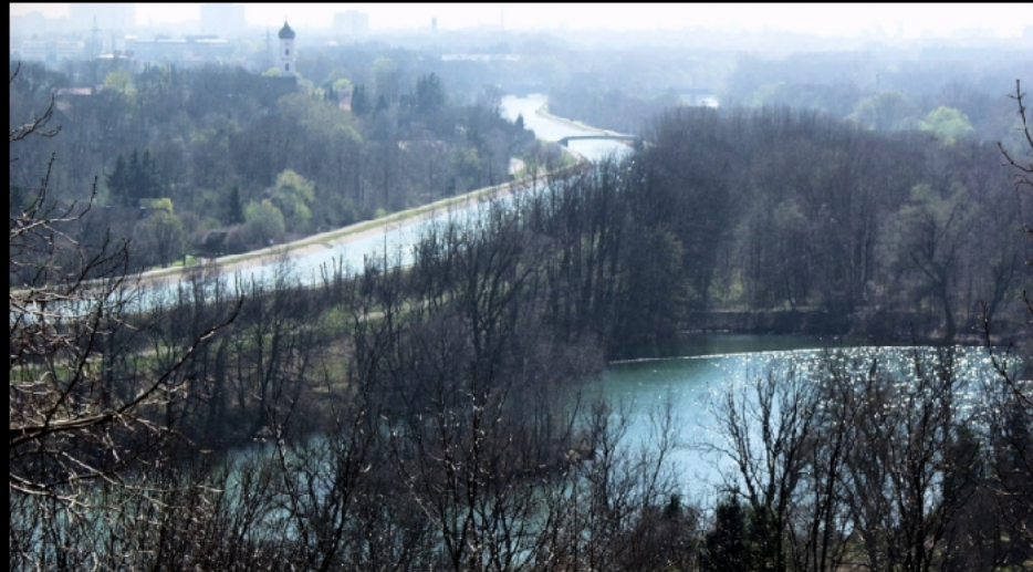
In der laublosen Zeit blickt man vom Berg für Weltkriegsschutt über dem Poschinger Weiher in Unterföhring auf den Abfluss des Isarkanals nach dem Oberföhringer Wehr.