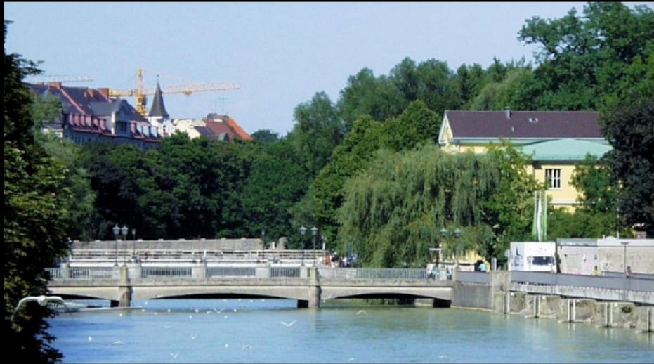
Mariannenbrücke und Wehrsteg im Vordergrund, Praterwehrbrücke und Maximiliansbrücke im Hintergrund, Gebäude des Alpen Museums auf der Praterinsel