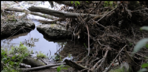
Wildnis, Biotop oder Urwald direkt an Isarufer und Böschung unter dem Herzogpark