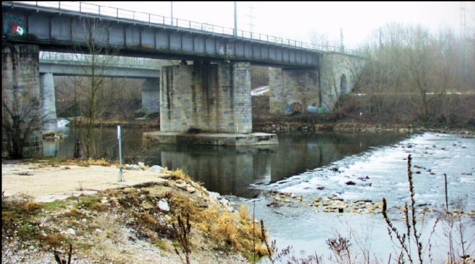
Zwischen Leinthalerbrücke und Föhringer Eisenbahnbrücke ist die Verwaltungsgrenze der Landeshauptstadt und des Landkreises München mit der Gemeinde Unterföhring.