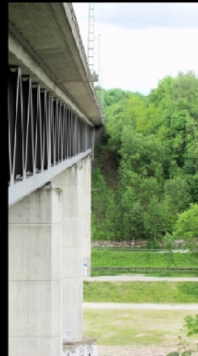
Die Bayerische Oberlandbahn (BOB) fährt über das Isartal. Unterhalb der Gleise im Fachwerkrahmen befindet sich ein kombinierter und komplett vergitterter Fuß- und Radweg.