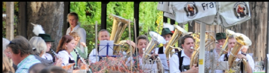
Natur ohne und mit Grill und Lagerfeuer oder Biergarten mit Blasmusik am Flaucher