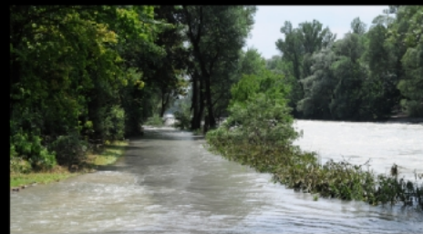
Die Sandbänke zwischen Wehr und Brücken sind verschwunden, der Weg danach auch.