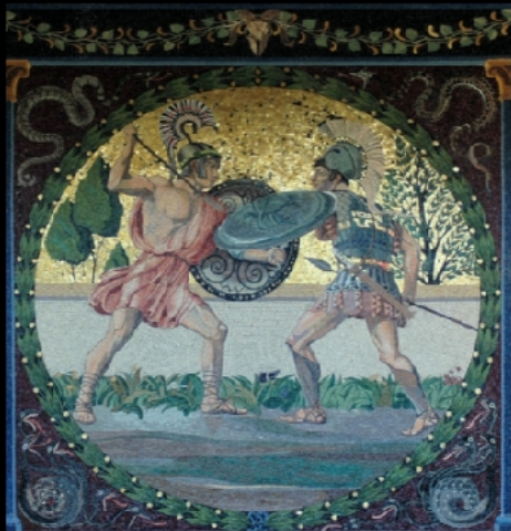
Mosaik Nord – Krieg