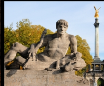
Friedensengel mit 38-Meter-Säule, Treppenbauwerk, Kornhalle und Delphinbrunnen