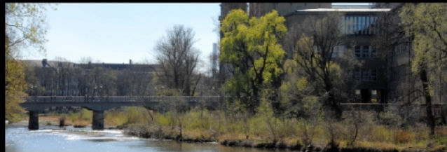
Auf einem Vorsprung der Corneliusbrücke befindet sich eine Büste mit Ludwig II. Boschbrücke und Zenneckbrücke führen zur Insel mit dem Deutschen Museum.