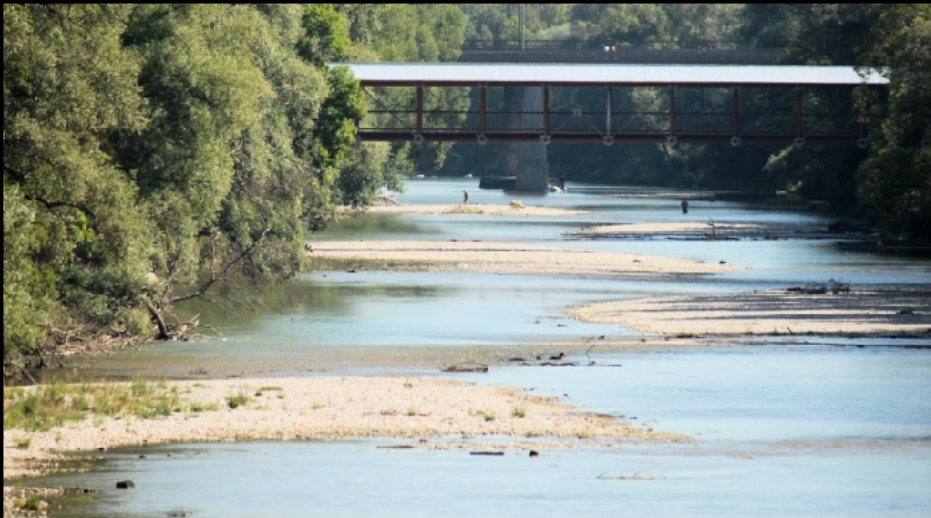
Die drei Brücken hinter der St.-Emmeram-Brücke sind Herzog-Heinrich-Brücke mit dem Föhringer Ring, Leinthalerbrücke mit einem Fußweg und Föhringer Eisenbahnbrücke.