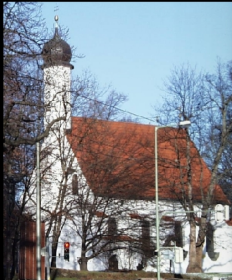
Eingang des Müllerschen Volksbads und St. Nikolaikirche am Isarhochufer beim Gasteig