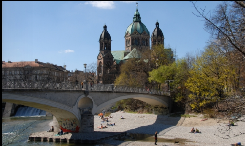
Kabelsteg zur Praterinsel und evangelisch-lutherische Pfarrkirche Sankt Lukas