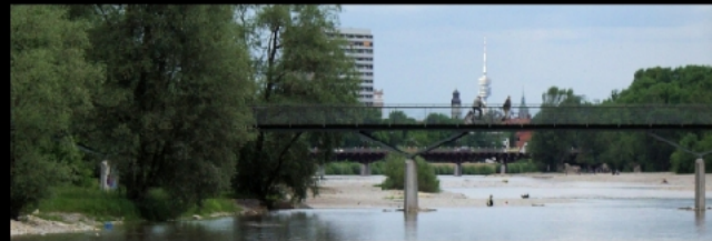
Thalkirchner Brücke, Marienklauenbrücke und großer Kamin des Heizkraftwerks München Süd, mit 176 Metern zweithöchstes Bauwerk nach dem Olympiaturm