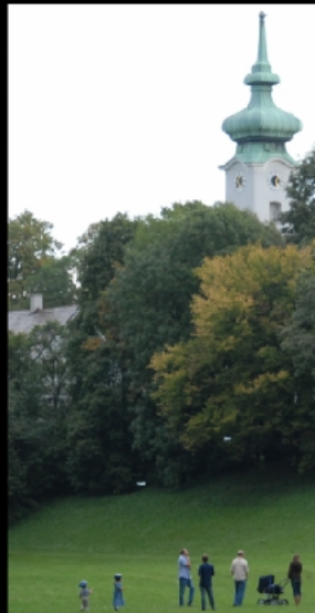
Pater-Delp-Denkmal südlich des Pfarrhauses von St. Georg, der letzten Wirkungsstätte