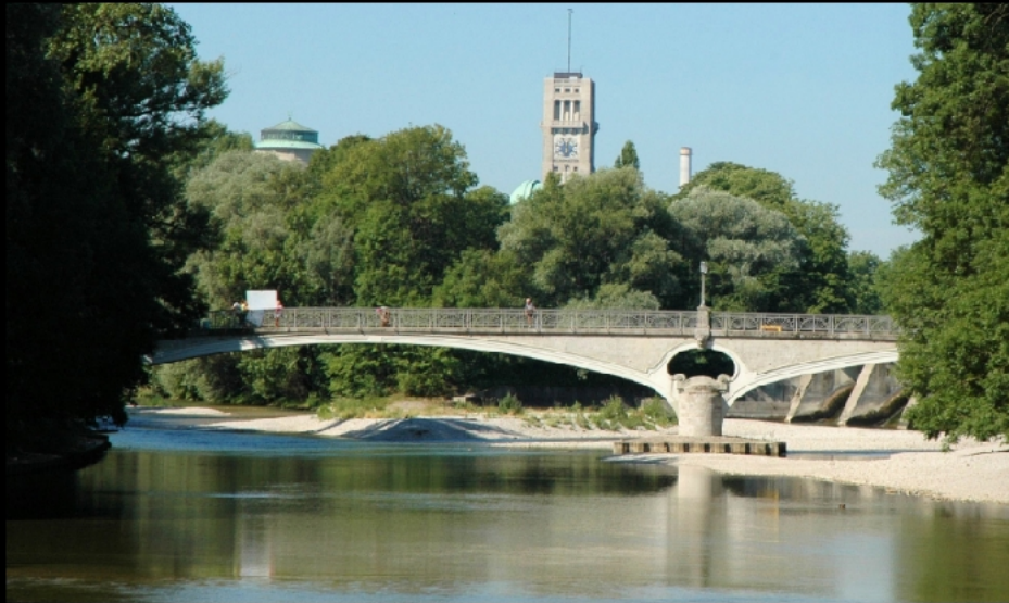
Rückblick auf den Kabelsteg, den Museumsturm und den großen Kamin in Sendling