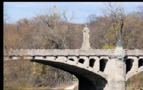
Äußere Maximiliansbrücke mit Statue der Pallas Athene aus dem Jahr 1905