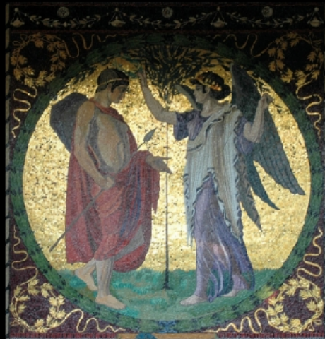
Mosaik Süd – Sieg