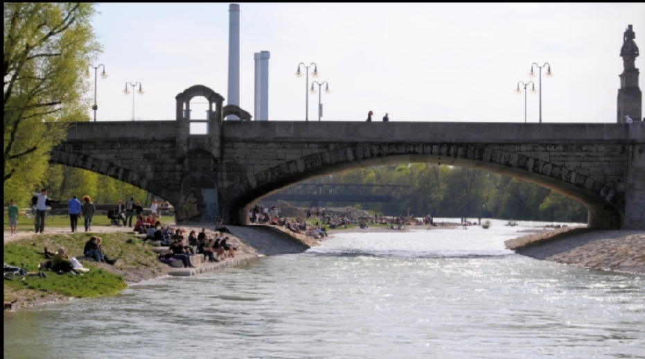
Die Brudermühlbrücke als Bestandteil des Mittleren Rings ist hier ohne Abbildung. Die Braunauer Eisenbahnbrücke zeigt sich unter dem Bogen der Wittelsbacher Brücke.