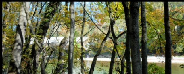
Isar nach der Luitpoldbrücke mit Blick auf Sandbank, Max-Josef-Brücke und Hilton Hotel