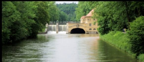
Isar mit Werksanlagen, Damm und Isar-Werkskanal sowie Marienklausensteg