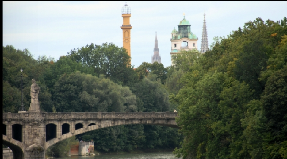
Pallas Athene blickt von der Maximiliansbrücke auf den Kamin des Muffatwerks, Heilig-Kreuz-Kirche in Giesing, Turm des Müllersches Volksbads und Mariahilfkirche in der Au.