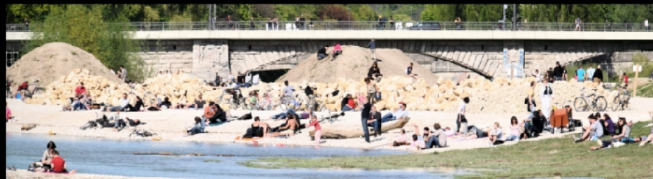
Reichenbachbrücke mit St. Maximilian vor und während der Renaturierungsarbeiten