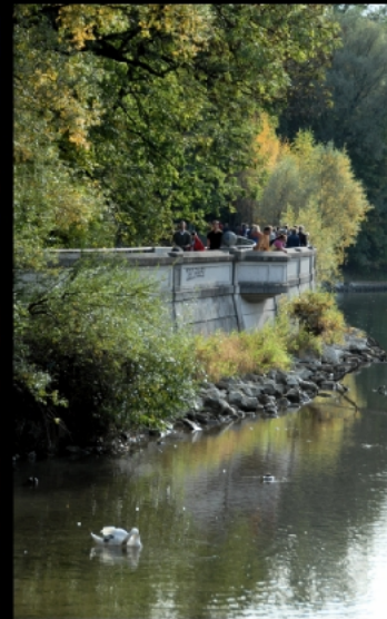
Schaukelfreuden an der Praterinsel und Spaziergänger nahe der Maximiliansbrücke