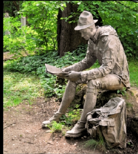
Garten des Alpen Museums mit geologischem Lehrgarten und lebensgroßer Aluminiumskulptur von Michael Friedrichsen mit dem Titel Der Wanderer