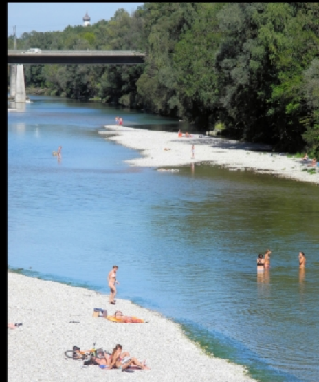
Isarstrände auf Sandbänken zwischen Oberföhringer Wehr und Herzog-Heinrich-Brücke