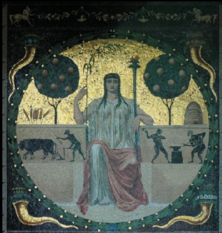
Mosaik Ost – Segen der Kultur, Demeter