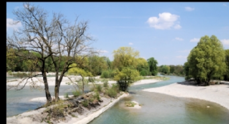
Flachersteg über die Thalkirchner Überfälle, ein Wehr und mehrere Kiesinseln