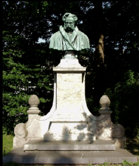
Denkmal für Franz von Kobell in den Maximiliansanlagen hinter dem Hofbräukeller