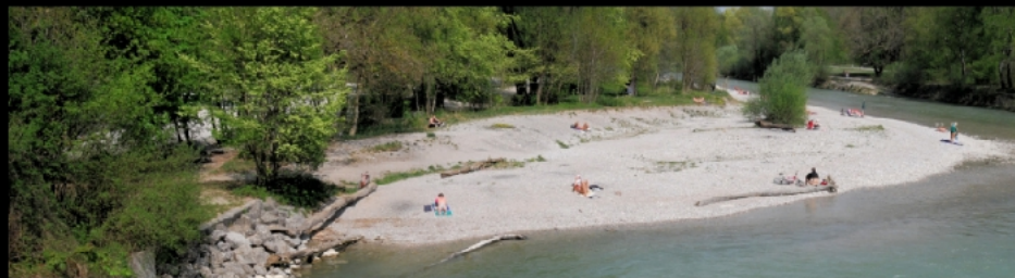
Der Flaucher vermittelt einen Eindruck des einstigen Wildflusscharakters der Isar.