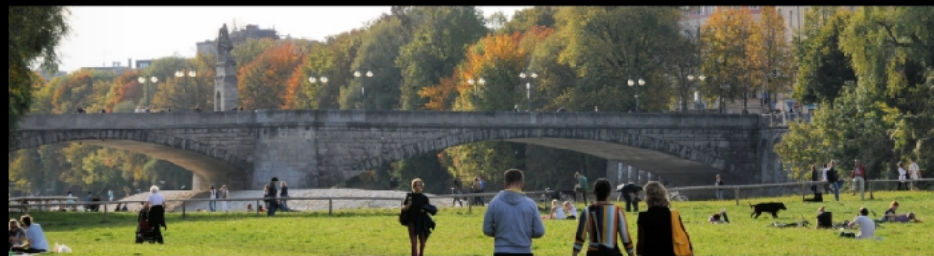
Gesamte Wittelsbacherbrücke mit Reiterstandbild Otto I. bei der Renaturierung