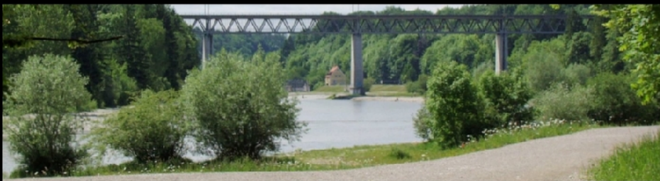
Zufluss der Isar ins Münchner Stadtgebiet unter der Großhesseloher Eisenbahnbrücke