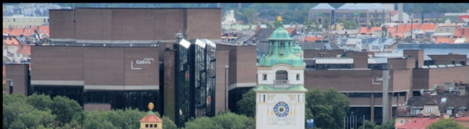
Ausblick vom Alten Peter auf Maximilianeum, Volksbad und Kulturzentrum am Gasteig