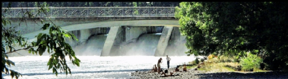
Wehr und Wehrsteg mit Fußgängern sowie Kabelsteg mit Wehr im Hintergrund