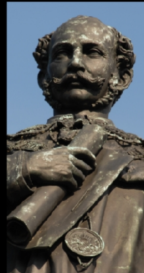
Maxmonument, großes Denkmal zu Ehren des bayerischen Königs Maximilian II.