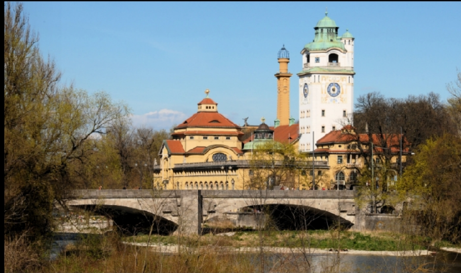
Müller'sches Volksbad und östlicher Teil der Ludwigsbrücke in Fließrichtung der Isar