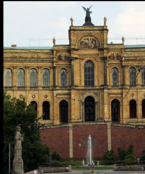
Maximilianeum mit Teleoptik vom Max-Joseph-Platz und von der Maximiliansbrücke