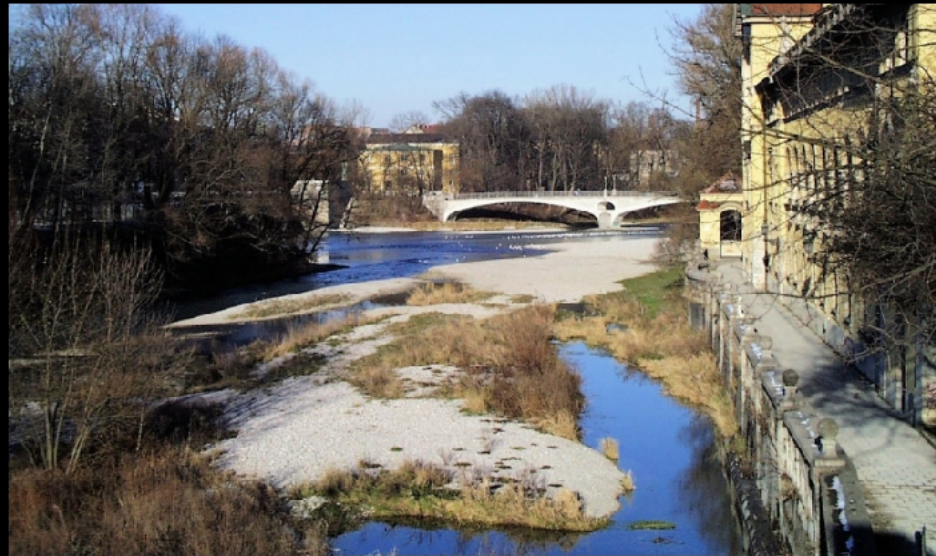
Zentrumsnaher Isarstrand und Weg am Volksbad mit Blick auf Praterinsel und Kabelsteg