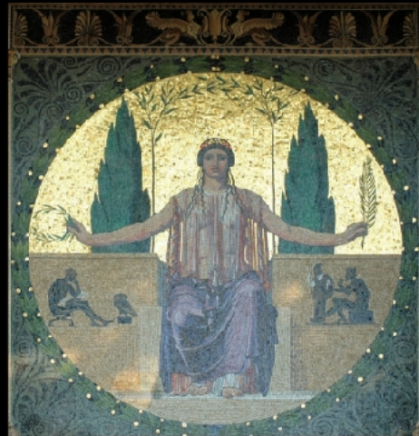
Mosaik West – Friede, Eirene