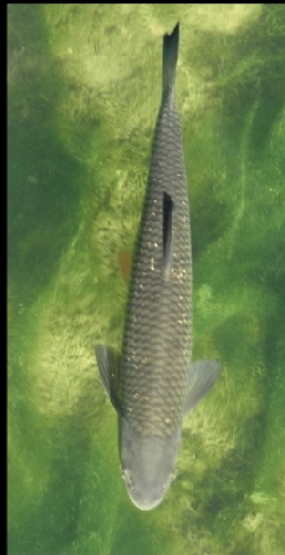
Bei Niedrigwasser und Windstille kann man Fische unter der Mollbrücke beobachten.