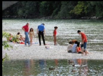
Münchener Kindl an der Max-Joseph-Brücke sowie Sandbank und Isarflimmern südlich