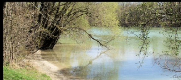
Mündung des Eisbachs in die Isar mit dem Oberföhringer Wehr im Hintergrund