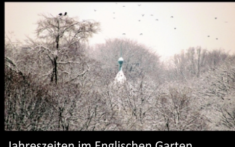
Jahreszeiten im Englischen Garten