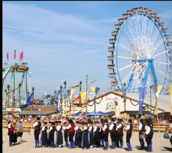
Bavaria, Riesenrad und Blaskapelle vor dem Festzelt der Historischen Wiesn beim 200jährigen Jubiläum des Oktoberfests 2010