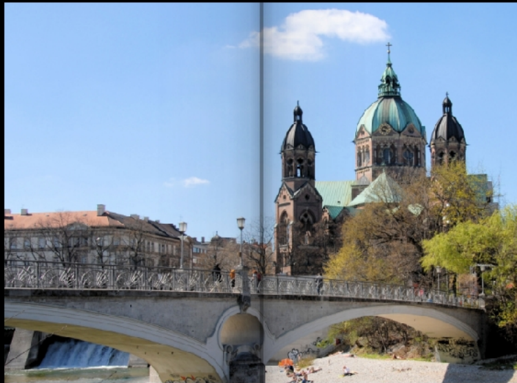
Kabelsteg und Sankt Lukas