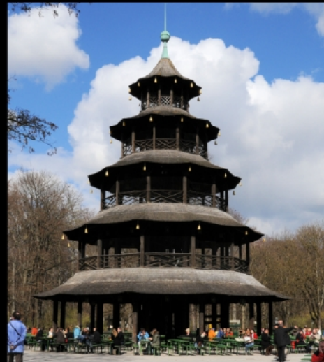
Englischer Garten mit Monopteros und Chinesischem Turm