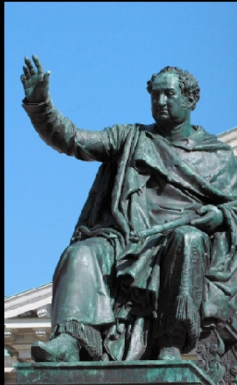
König Maximilian I.