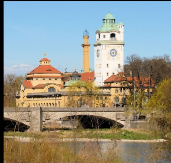
Ludwigsbrücke und Müllersches Volksbad