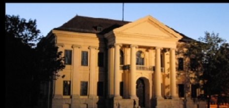
Siegestor, Gärtnersplatz, Staatskanzlei, Prinz-Carl-Palais