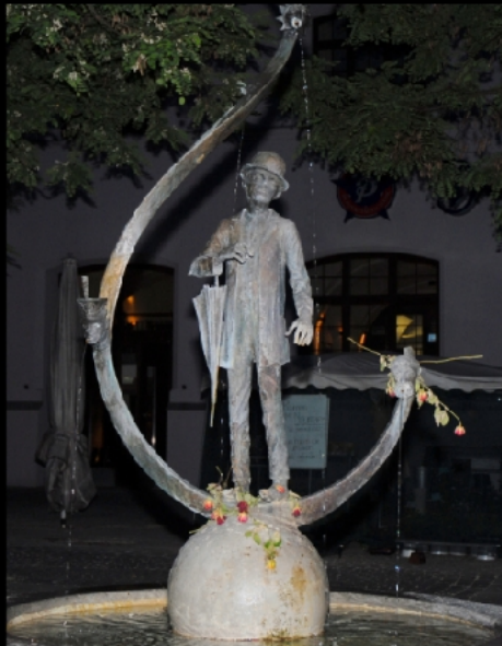
Volkssängerbrunnen von Karl Valentin und Liesl Karlstatt auf dem Viktualienmarkt, Grab der Liesl oder Elisabeth Wellano auf dem Bogenhausener Friedhof