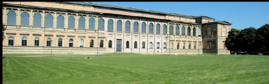
Glyptothek, Propyläen und Antikensammlung, Alte Pinakothek