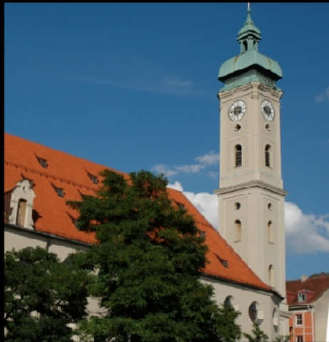
Frauentürme, Alter Peter und Rathausturm mit Münchner Kindl, alter Rathausturm, Heilig-Geist-Kirche im Tal