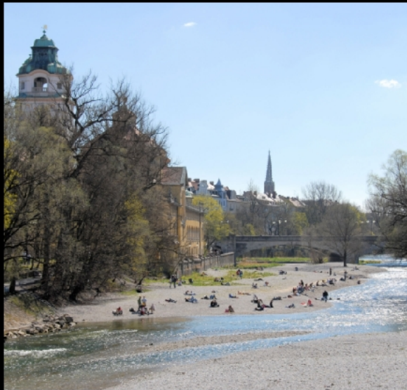
Isarstrand bei Volksbad und Ludwigsbrücke