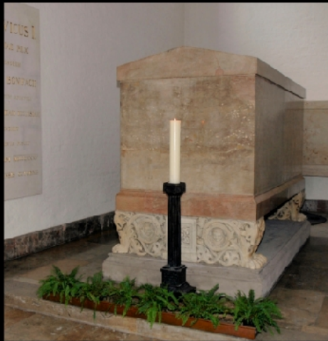
Ludwigskirche, Siegestor, Feldherrnhalle, Reiterstandbild Ludwig I. am Odeons- platz, Grab in Sankt Bonifat