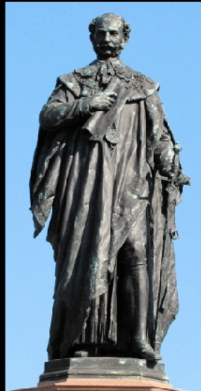
König Maximilian II.