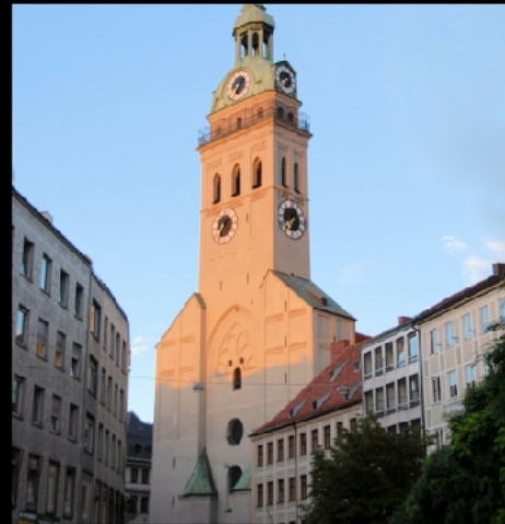
Marienplatz, Rathaus mit Glockenspiel, Mariensäule und Altes Rathaus, Sankt Peter