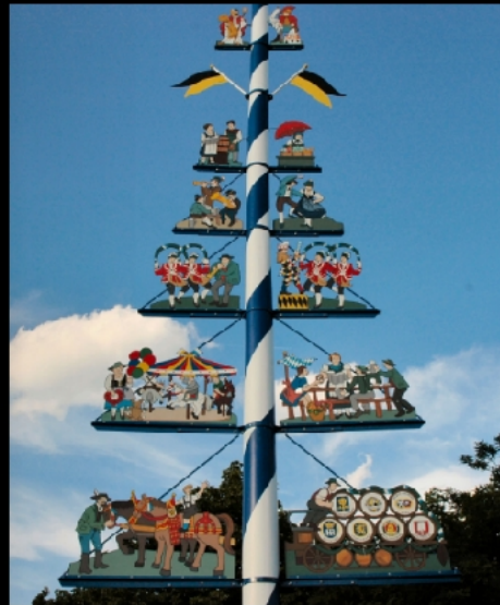
Maibaum auf dem Viktualienmarkt