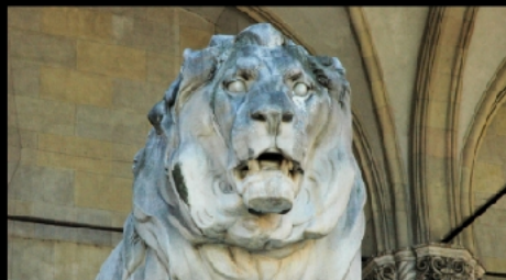
Der bayerische und der preußische Löwe vor der Feldherrnhalle