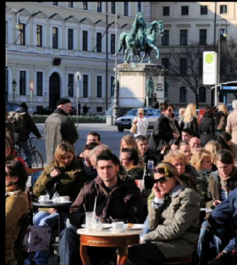
Nationaltheater, Marstallplatz, Tambosi am Hofgarten