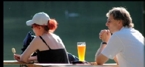
Biergarten am See und am Chinaturm, Touristen und das Münchner Bier