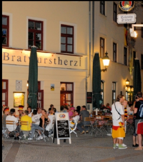
Weißes Bräuhaus im Tal, Bratwurstherzl am Dreifaltigkeitsplatz