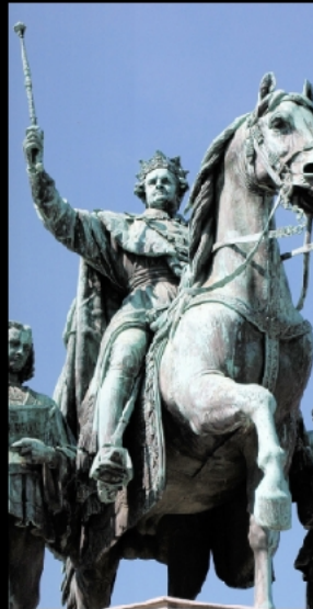
König Ludwig I.