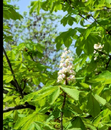
Rote und weiße Blütenpracht der Kastanienbäume im Biergarten am Aumeister