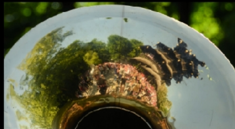
Guggenmusik aus Basel zum Champions League Finale im Mai am Chinesischen Turm