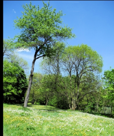
Wege, Wiesen und Bäume zwischen Eisbach und Isar kurz vor der Eisbachmündung