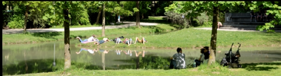
Chinesischer Turm: Kastanienblüte, Einmarsch, Durchmarsch, Überfüllung und Erholung