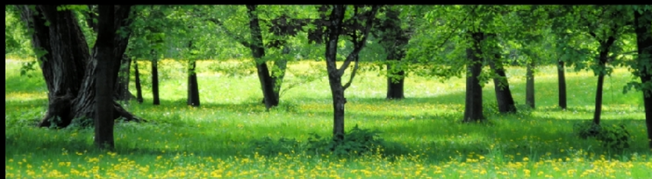
Wiesen der Hirschau über Resten der Lokomotivfabrik Maffei vor dem ersten Mähen