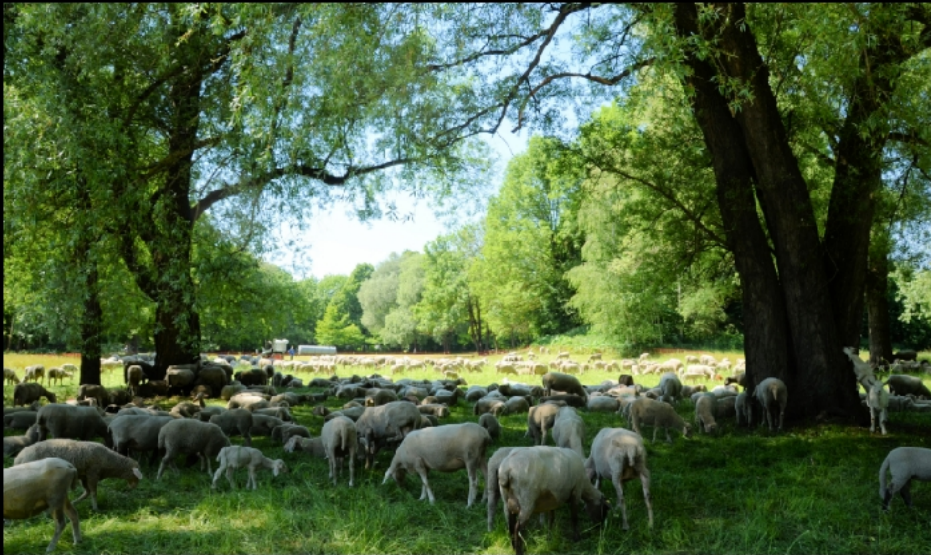
Den Schafen schmeckt das Blütenmeer in der Hirschau.