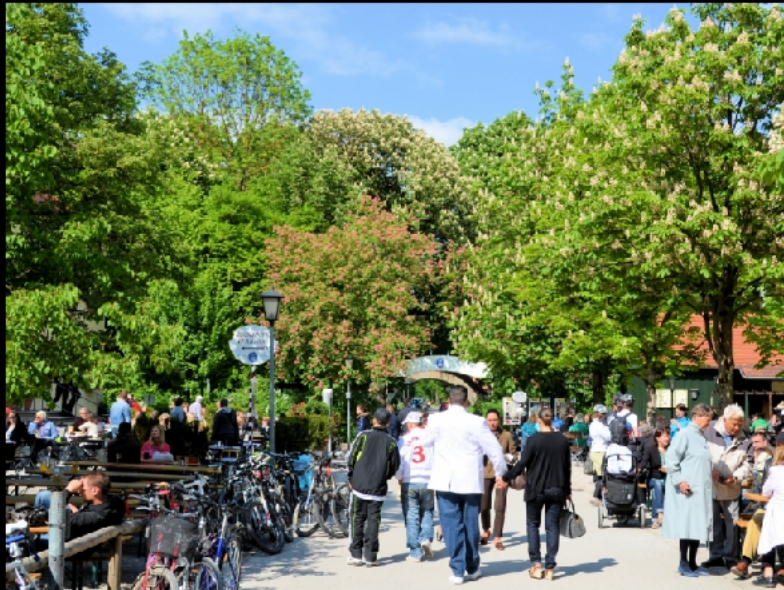
Englischer Garten im Mai