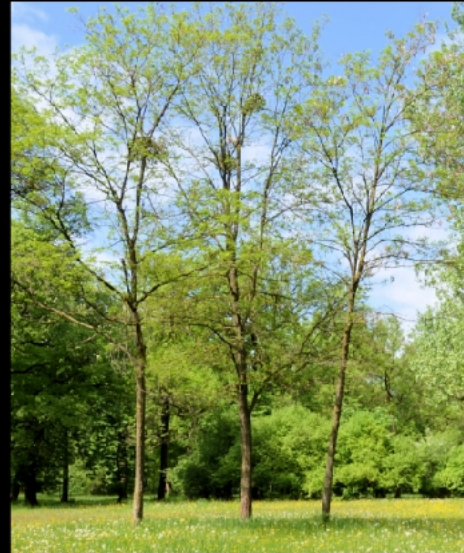
Bäume am Anfang und in der Mitte des Wonnemonats nahe beim Stauwehr Oberföhring