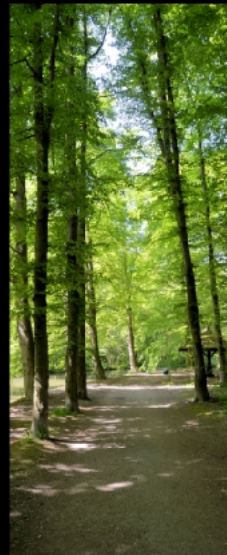
Gehweg am Entenfallweiher, an dem es keine Falle fur Enten oder gefallene Enten gibt