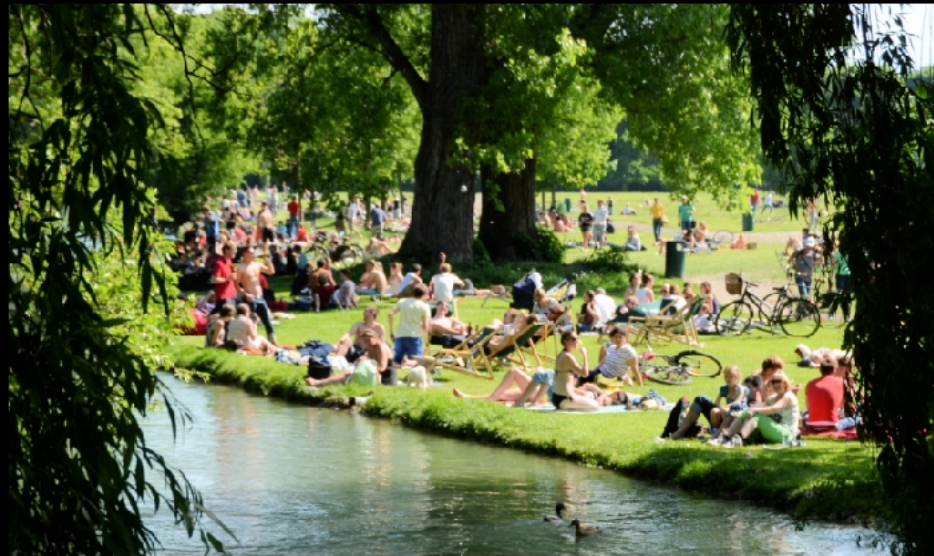
Sonnenbaden am Schwabinger Bach mit vielen roten Trikots des FC Bayern München