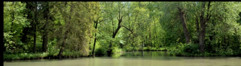
Oberstjägermeisterbach nach der Reitwiese und Ansichten des Schwammerlweiher