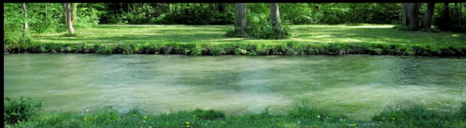
Schwabinger Bach an der letzten Brücke vor dem Aumeister und Schwabinger Bucht