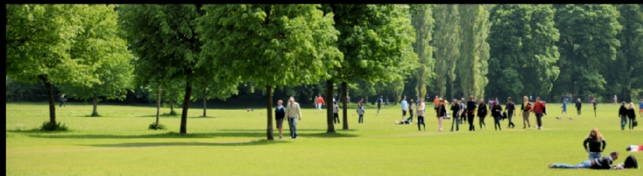
Carl-Theodor-Wiese mit Monopteros und Werneckwiese mit Kleinhesseloher See