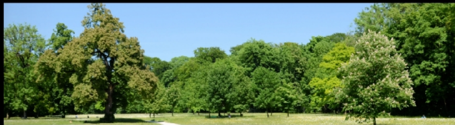
Ansichten am Oberstjägermeisterbach, Stimmung vor und nach einem Gewitter im Mai