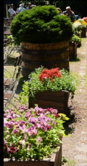
Tivoli Pavillon zwischen blühenden Kastanienbäumen und mit geschmücktem Garten